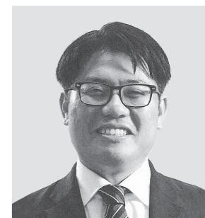
みんなでつくる党 公認

現役世代を中心とした、若者が参加したくなる政治づくりを目指しています。「彩り豊かな未来」をみんなで一緒に作りましょう。