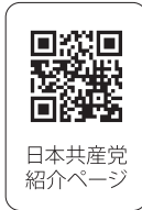
日本共産党紹介ページ